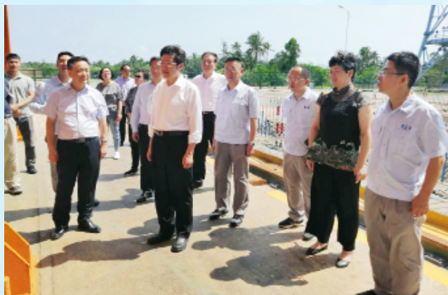
视察团一行在文昌航天城视察。