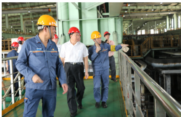
调研组在宝钢湛江钢铁集团调研。