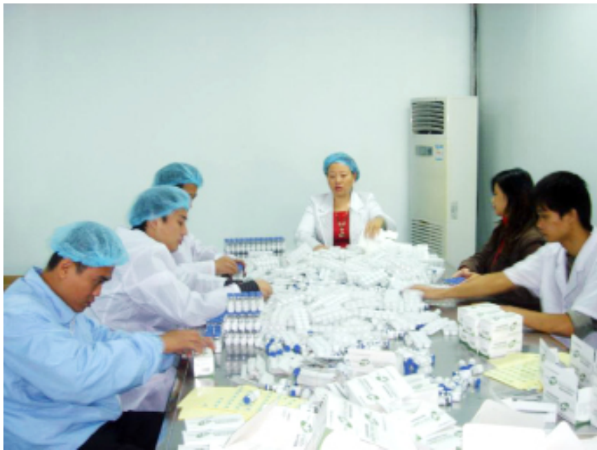
蔡伦委员与同事正在研究生产事项