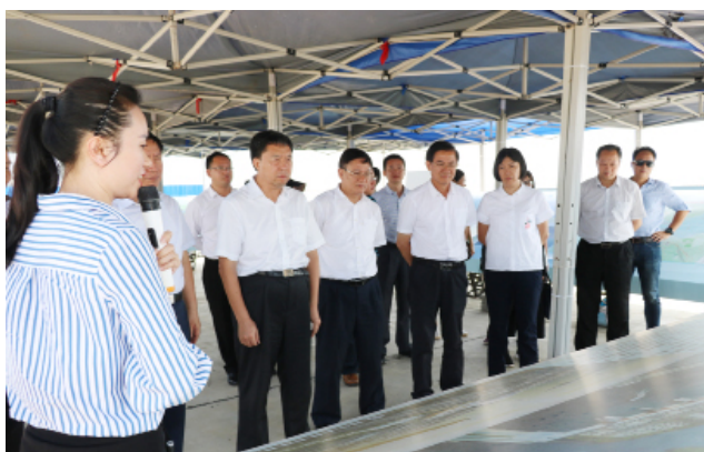
调研组在徐闻县南山港听取情况介绍。