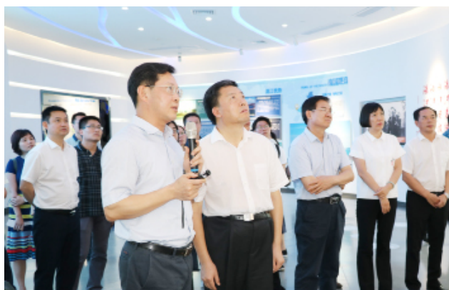
调研组在湛江市规划展览馆听取情况介绍。