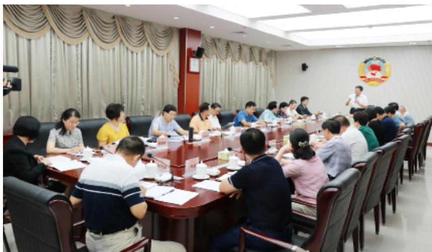
5月30日,调研组召开调研成果论证会。

6月3日至10日,调研组按照海南省党政考察团出访考察报告的精神,围绕如何借鉴迪拜等地经验、充分发挥园区在海南自贸港建设中重要引擎作用,继续探讨、深入分析,在吸收各方意见后,全面梳理了全省园区在创新发展的“痛点”和“堵点”所在,