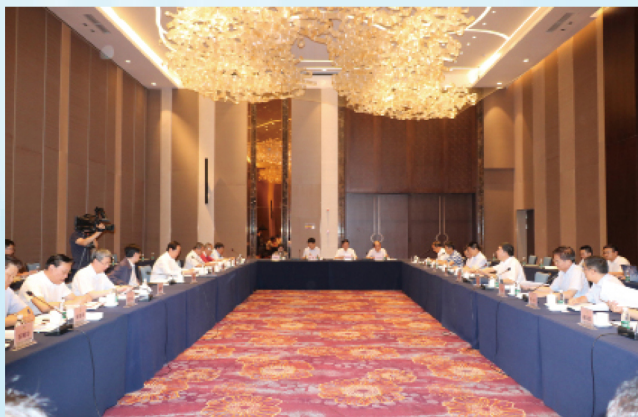
调研组一行与海南省领导及相关部门负责人进行座谈。