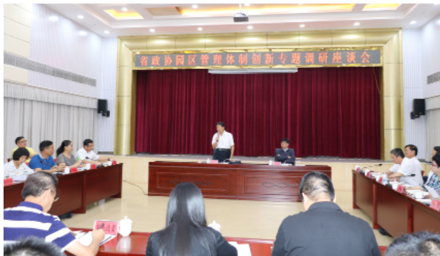
5月24日，调研组在东方召开座谈会，听取情况汇报。

理体制机制创新有什么困难和想法，调研组成员有什么问题也要当场咨询。”每到一地，调研组开宗明义，表明来意。5月21至22日，海口市、澄迈县等市县提出园区管理缺位，区内企业意见较大，公共设施和老城经济开发区存在不衔接、不兼容等问题；23日，琼海市从园区企业引进、招商园区企业、安置园区农户等