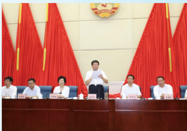
省政协主席毛万春主持会议并讲话。