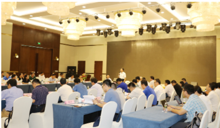
5月23日，调研组在琼海召开座谈会，听取博鳌乐城医疗先行区情况汇报。

主席、一位秘书长、四个专委会主任、省工信厅、省发改委等相关职能部门负责人及专家学者组成。第二天，毛万春在调研的路上和成员们共同制定调研方案，分解细化出调研路线图。一致认为要按照习近平总书记“4·13”重要讲话精神和中央12号文件总体要求，贯彻落实省委意图，学习借鉴国内外先进园区管理经验，紧扣海南园区发展实际，杂糅百家，为我所用。尤其是要充分听取各方意见和诉求，所提建议力求兼顾各方利益，尽可能提出两个比选方案作为领导决策参考；不求面面俱到，力求对症下药、解决问题。“经过讨论，我们统一了思想，就会有所为地开展调研活动”。方向明了，就有了施策的方法。