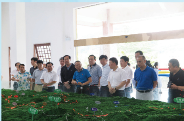
调研组在陵水县吊罗山国家森林公园调研。