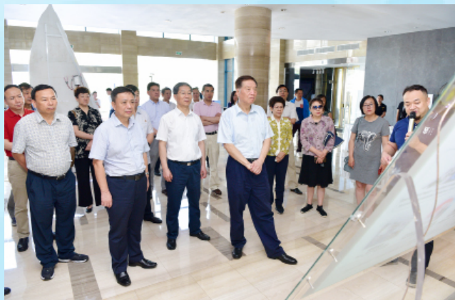
视察团一行在三亚视察。

4月21日至25日，全国政协常委视察团在琼就“推进海洋经济发展示范区建设”开展视察。全国政协副主席、全国工商联主席高云龙，全国政协常委、经济委员会副主任于广洲参加视察。