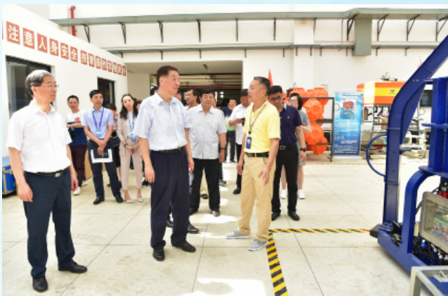
视察团一行在中科院深海研究所视察。