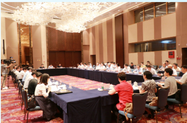
视察团一行与海南省领导及相关负责人进行座谈。