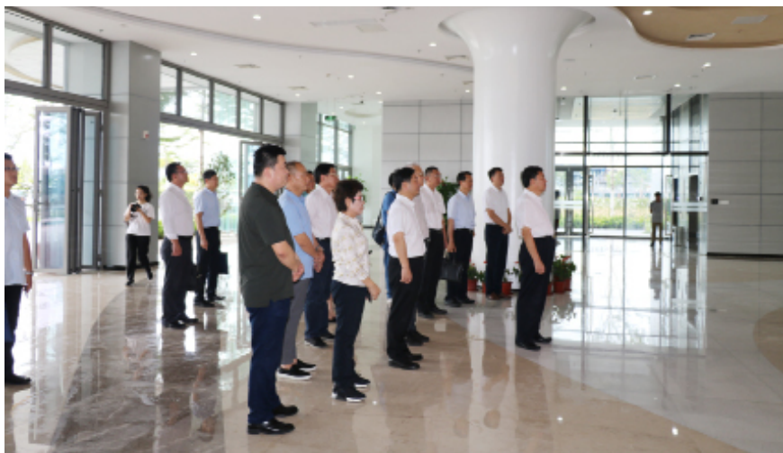
5月25日,调研组在三亚市崖州湾科技城调研。

基础。三亚市的崖州湾科技城实行“一区多园”管理模式,产业方向清晰、行业特点鲜明,由各专业化运营平台管理。调研组先后在海口、澄迈、琼海、东方、洋浦、三亚等市县(区)实地走访8个园区,走访了20多家企业,召开了10多场座谈会,调研组除了详细地了解园区建设规划,广泛听取各方诉求和意见,调研报告反复推敲,几易其稿。