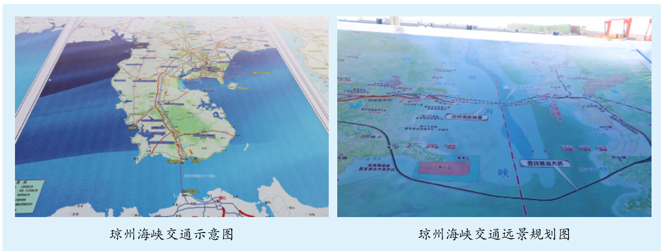
琼州海峡交通示意图