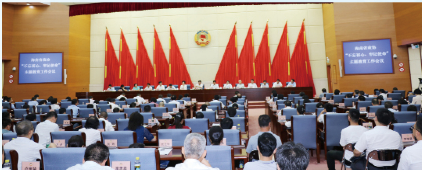
6月10日晚，省政协“不忘初心、牢记使命”主题教育工作会议在海口召开。