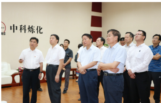
调研组在湛江中科（广东）炼化有限公司听取情况介绍。